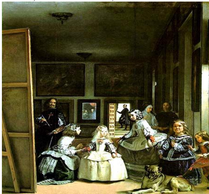
Velázquez, Las Meninas , (La famiglia di Filippo IV), 1656, olio su tela, Museo Nacional de Prado, Madrid

Al centro di una ampia e lussuosa sala c'è l'infante Margherita, circondata dal suo seguito, le damigelle, la nana, il cane, tutti intenti, almeno ad un primo sguardo, a mostrare la loro devozione e incondizionata ammirazione nei confronti della principessina 24 . Tuttavia, uno studio più attento del dipinto rivela anche la presenza dell'artista, Diego Rodríguez de Silva y Velázquez, in piedi davanti un cavalletto che sostiene una grande tela, su cui egli sta ritraendo i reali di Spagna, Filippo IV e Marianna d'Austria, dei quali si scorgono i