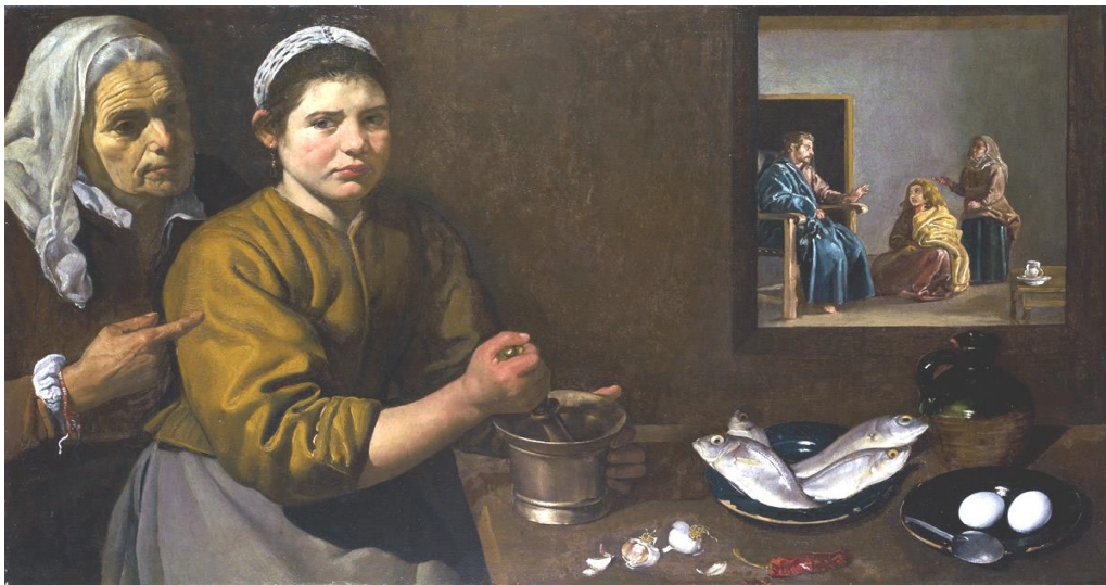
Velázquez, Cristo in casa di Marta e Maria , 1620 circa, olio su tela, The Trustees of National Gallery, Londra

Nelle sue opere confluisce tutta la cultura della sua età e gli studi approfonditi sull'arte italiana, alimentati soprattutto attraverso numerosi viaggi e lunghi soggiorni in Italia, che hanno contribuito ad equilibrare il cromatismo delle sue opere e a dare ordine razionale alle sue composizioni.