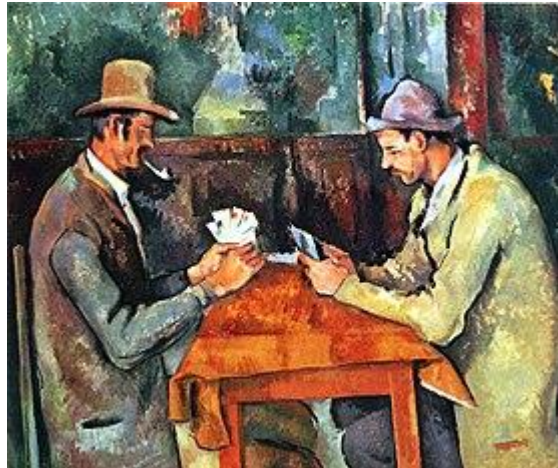
P. Cézanne, Giocatori di carte , 1890-1895, olio su tela, Museo d'Orsay, Parigi

In questi termini, parafrasando le riflessioni di Cézanne, l'arte dell'interpretazione non è destinata ad esaurirsi in una attività statica e fine a se stessa, ma si rivela parte integrante del processo ermeneutico quale momento di sintesi tra l'astrattezza dell'opera e la concretezza della situazione, ove è destinata a vivere, garantendone così l'efficace e perenne dimensione sostanziale.