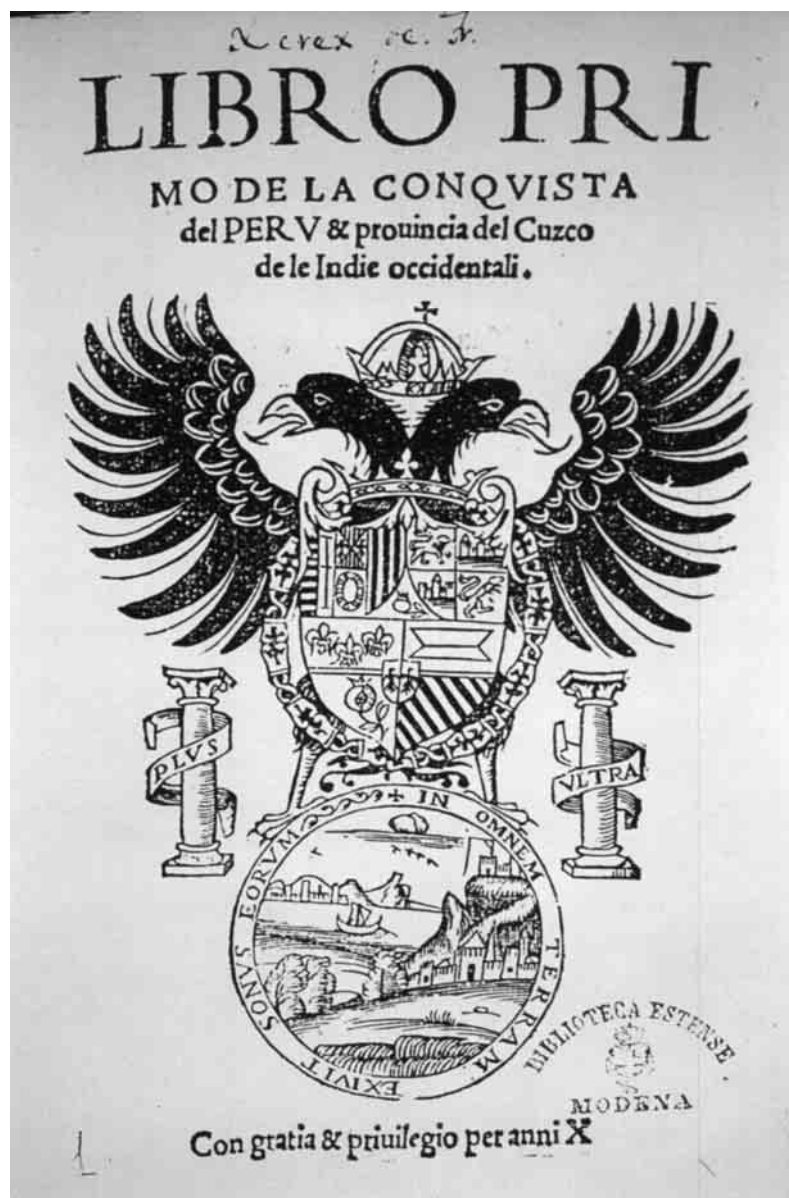
Figura 2 – Frontespizio di [F. Xeres], Libro primo de la conquista del Peru et prouincia del Cuzco de le Indie occidentali , Venezia, per Stefano da Sabio, 1535.