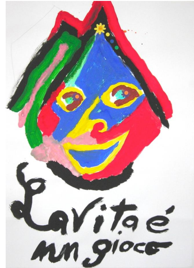
Fig. 2 – A., Volto

In hospice il tempo non si fonda sui minuti scanditi dall'orologio ma sulla costruzione di una relazione di senso con l'altro. Nella figura n. 4, l'immagine di S., familiare, ci rimanda al forte legame che la malattia grave e la