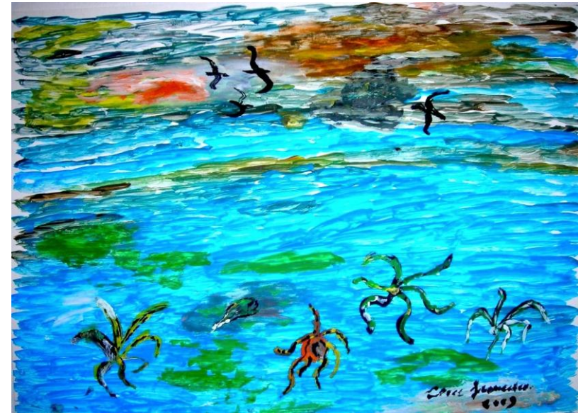
Fig. 1 – G., Paesaggio marino

Nell'immagine creata da M., moglie di un paziente in fin