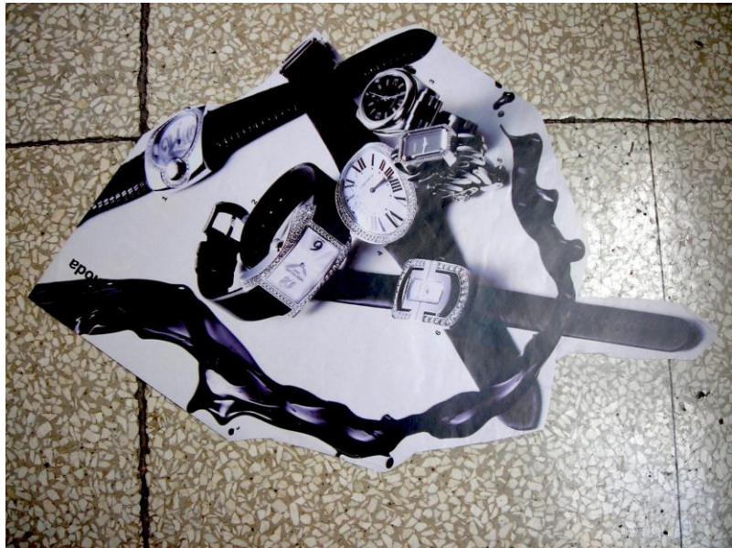
Fig. 4 – S., Il tempo

l'aldilà, le ragioni della propria sofferenza, gli scopi della vita, la possibilità del perdono, esse non pretendono, da chi assiste il paziente, una risposta di contenuto e tuttavia la presenza di chi assiste è molto importante, perché il travaglio spirituale ha bisogno di un testimone. Curare i