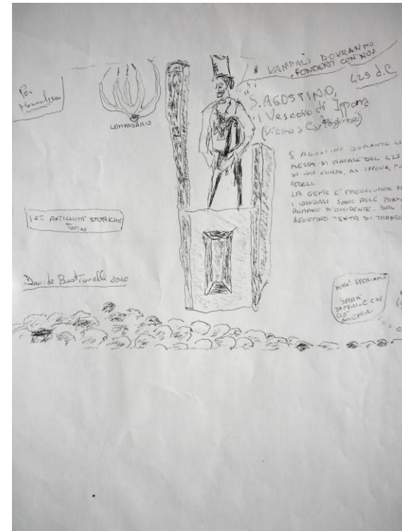
Fig. 5 – D., L'invasione dei barbari

morenti, afferma incisivamente Jomain, 5 significa sapere che un certo numero di essi sente la necessità di trovare di là da sé una sorgente cui dissetarsi.