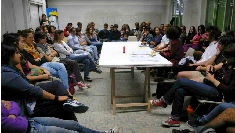
Fig. 5 - A. Cattani, momenti della performance degli studenti, per il progetto Mariposa , CRAC, Cremona, 2010.

comunità di interessi intorno a bisogni comuni. Occorre riflettere, sullo specifico, sulle pratiche, in che modo possono essere costruiti gli spazi comuni e condivisi, su temi controversi come le differenze, la coabitazione, i ritmi produttivi e le pratiche collaborative, per ritrovare un senso etico del vivere collettivo. “Il problema della didattica dell’arte tocca necessariamente da vicino il problema del destino dell’artista nel mondo contemporaneo e ogni tipo di pratica artistica”. 9