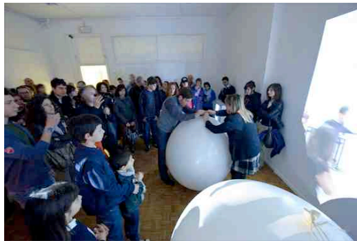
Fig. 4 - Incontro tra studenti del Liceo Artistico e dell'Accademia di Brera per il progetto Soppalcare , Aula Magna Liceo Artistico, Cremona, 2010.

La sfera pubblica dovrebbe essere il luogo del riconoscimento reciproco degli appartenenti a una collettività e delle modalità dell'agire collettivo in rapporto alla questione decisiva del "senso" dello stare insieme.