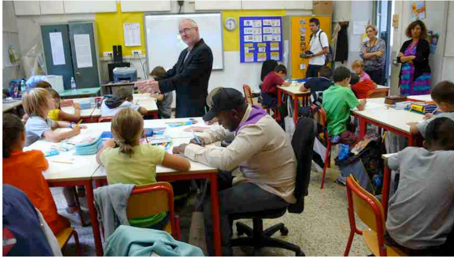
Fig. 7 - Tim Rollins invitato dal CRAC a tenere un workshop con alunni delle scuole primarie del I circ. Trento Trieste, Cremona, 2011.

Si apre, partendo dal locale e dai territori, uno spazio da percorrere, “la costruzione di democrazie ove le differenze e il senso di sé sappiano parlare e costruire politiche con l’altro da sé”. 15