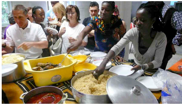
Fig. 2 - Momento conviviale tra studenti, genitori e la comunità ivoriana. Progetto triennale con una scuola della Costa d'Avorio, Aula Magna del Liceo Artistico, Cremona, 2008-2010.