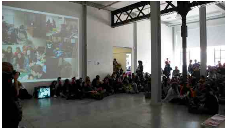
Fig. 6 - Il CRAC a Care Of per EducationLab , Fabbrica del Vapore, Milano, 2011.