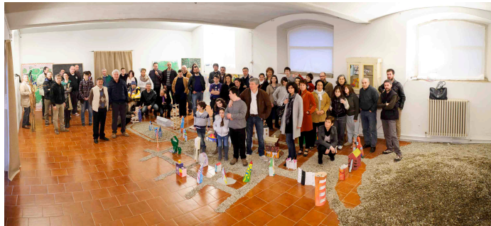
Fig. 9 - Osservatorio in Opera, Di Sguincio, B.go Loreto SP, Cremona 2012.

E ancora: “occorre pensare dunque come momento di rinascita a nuovi spazi simbolici, di passaggio all’inedito, all’imprevisto”. 19 Un testo, questo di Perticari, che mi ha permesso di ripensare e mettere insieme la questione educativa, la pratica didattica, l’idea di formazione, immaginando un luogo altro dedicato alle pratiche creative, un luogo come bene comune, dove attivare dei percorsi aperti alle relazioni, all’incontrarsi, all’accettarsi, accompagnandosi, ascoltandosi, imparando qualche cosa l’uno dall’altro. L’esperienza del CRAC nasce come un’anomalia nel contesto scuola, un terreno incolto , per esercitarsi a coltivare il bene comune, riattivare immaginari, piantare e nutrirsi di buoni frutti.