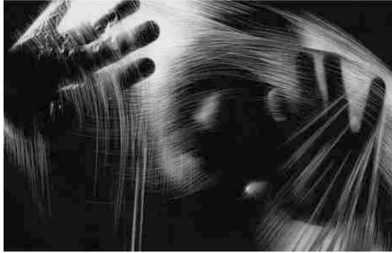
Fig. 1 - Bruno Taddei, Graffi dell'anima , 2010.

manuale sull'immagine, provo a essere parte attiva di una trasformazione non solo dell'immagine rappresentata, ma di me stesso, diventando protagonista di questa trasformazione.