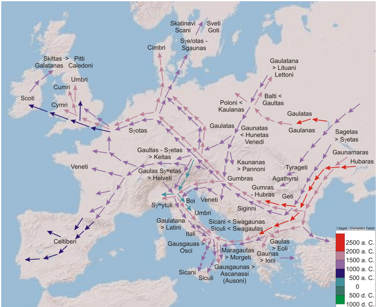
Figura 2 – Migrazioni dei Sageti in Europa.

Medi, si vestivano come essi e si estendevano fino ai Veneti dell'Adriatico. Lo storico riconosce di non essere in grado di spiegare come dei Medi fossero arrivati fino a quel luogo. E' probabile che i Siginni fossero coloni non dei Medi di Media, ma di quelli deportati dagli Sciti che avevano assunto il nome di Sauromati, poi Sarmati, e si erano mescolati ai Sageti o erano divenuti allevatori di vacche, ovvero * Swagaunas . Della presenza di popolazioni derivate dalla fusione di Sarmati e Sageti tra il Danubio e la Vistola, troviamo infatti testimonianza anche nel nome della capitale dei Daci Sarmizegetusa , del fiume Sargetia (ora Strei) [64] e dei Sargeti , che Ammiano Marcellino colloca nei pressi della Vistola vicino agli Arimfei e ai Massageti [65].