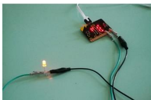
Laboratorio di coding

Realizzare un semaforo con le schede programmabili BBC:Microbit